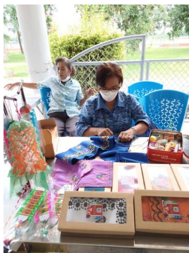
ลายผ้าปักฝีมือชาวมอญ ชุมชนบ้านศาลาแดงเหนือ