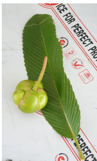
ผลและใบมะตาด

2.8) นอกจากนี้ ชุมชนยังเปิดโอกาสให้สมาชิกได้ผลิตอาหารและสินค้าเพื่อนำออกมาขาย เพื่อแสดงความเป็นเอกลักษณ์ของหมู่บ้านและชุมชนชาวมอญด้วย เช่น ผ้าปักลายฝีมือชาวมอญ และมะตาด ซึ่งเป็นไม้ยืนต้นที่คนไทยเชื้อสายมอญรู้จักมาเนิ่นนาน และนำมาประกอบอาหารหลายอย่าง เป็นต้น