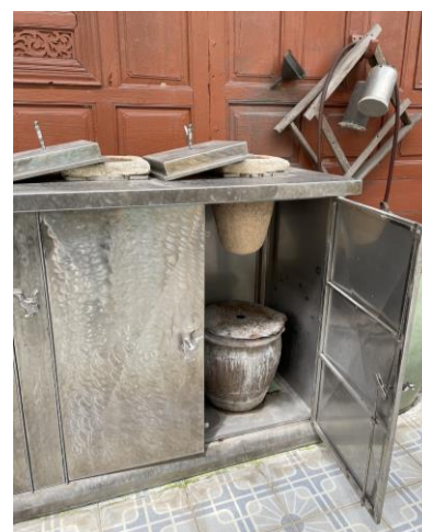
เครื่องกรองน้ำโบราณ ภูมิปัญญาชาวมอญ