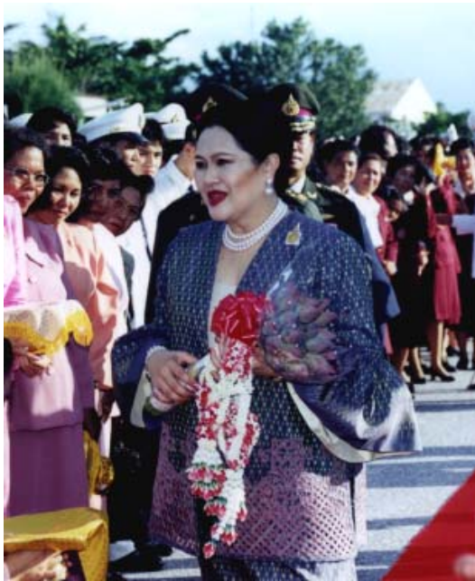
สมเด็จพระนางเจ้า พระบรมราชินีนาถ ไม่เพียงแต่ทรงบริหารงานของมูลนิธิส่งเสริมศิลปาชีพ เท่านั้น พระองค์ยังทรงพยายามทุกวิถีทางที่จะช่วยให้เกิดความนิยมในผลิตภัณฑ์จากศิลปาชีพ โดยทรงเป็นผู้นำในการใช้ผลิตภัณฑ์ศิลปาชีพอยู่เสมอ

นอกจากโรงฝึกศิลปาชีพสวนจิตรลดาแล้ว สมเด็จพระนางเจ้า พระบรมราชินีนาถยังทรงพระกรุณาโปรดเกล้าฯ ให้จัดตั้งศูนย์ศิลปาชีพในภาคอื่นๆ อีกเป็นจำนวนมาก เพื่อเป็นศูนย์การเรียนการสอนและการผลิตงานศิลปาชีพในท้องถิ่นนั้นๆ เช่น ศูนย์ศิลปาชีพบ้านกุดนาขาม จังหวัดสกลนคร ศูนย์ศิลปาชีพบ้านแม่ต๋ำ จังหวัดลำปาง ศูนย์ศิลปาชีพพระตำหนักทักษิณราชินีเวศน์ จังหวัดนราธิวาส และศูนย์ศิลปาชีพบางไทร จังหวัดอยุธยา เป็นต้น